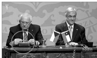
Bývalý prezident ČR Václav Klaus (vlevo) při práci v Chile, záběr z publicistického pořadu CT, 2011

Ve vši práci a v práci drobné mít mravní direktivu s hlediska věčnosti a nekonečnosti: národ náš, jako každý jiný pokračující a vyspělý národ, musí si uvědomit svůj úkol, neboť také nábožensky každý národ má svůj úkol. Tomáš G. Masaryk