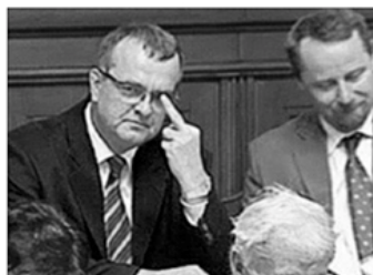
Ministr financí vlády ČR Miroslav Kalousek při práci v Poslanecké sněmovně Parlamentu ČR, 2008